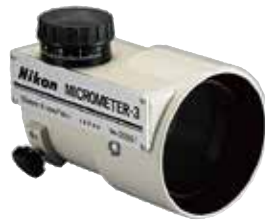
●オプティカルマイクロメーター 3 型