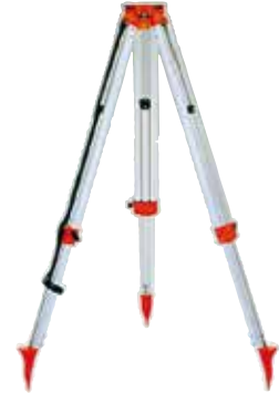
●伸縮三脚 BM-II シリーズ 全長 (175cm / 4.5kg)