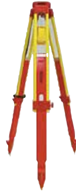
●高級伸縮三脚 AWF-IV (木製) 全長 (175cm / 7.4kg)