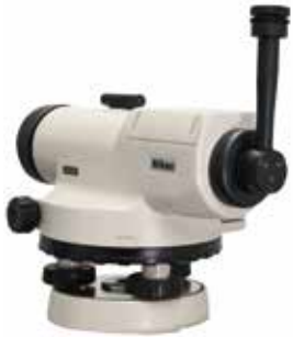
●ダイアゴナルアイピース